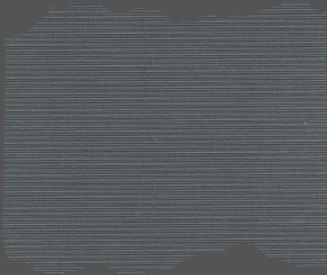
9001 Charcoal Grey